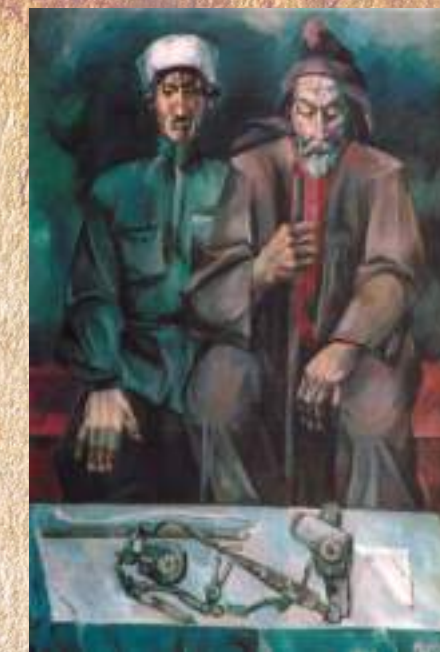
АМЦАР Т. А. АГФАЛАШФАРА