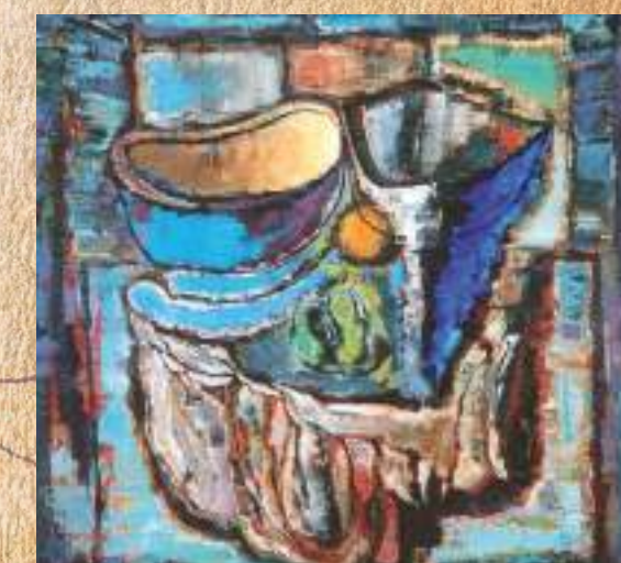
КОТЛИАРОВ Е. Г. АНАТИУРМОРТ