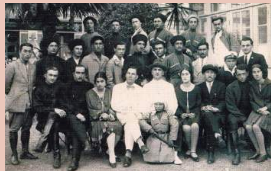
1-й Абхазский гостетр на гастролях в Батуми