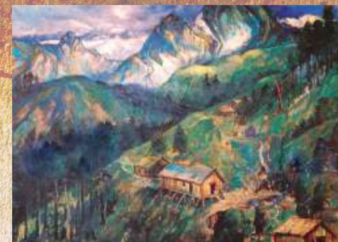
КОНТАРЕВ В. С. АШЬХАТӘ ПЕЙЗАЖ