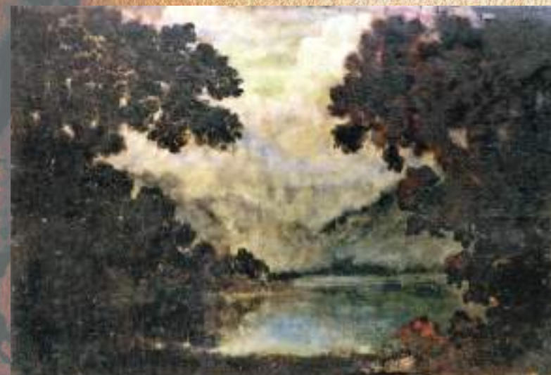
«АЗЫЛАХАҚӘА РЗИА» ИАЗКУ АДЕКОРАЦИЯ