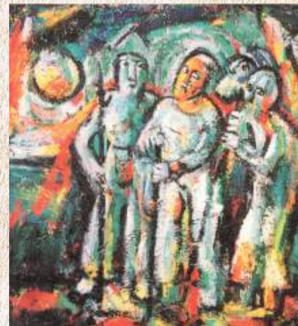
ЛАКРБА В. К. АМХАЦЪЫРЦФА