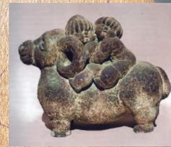
ХФЫРХФМАЛЦХА В. И. АФЕЫБГАКАЗАЦФА