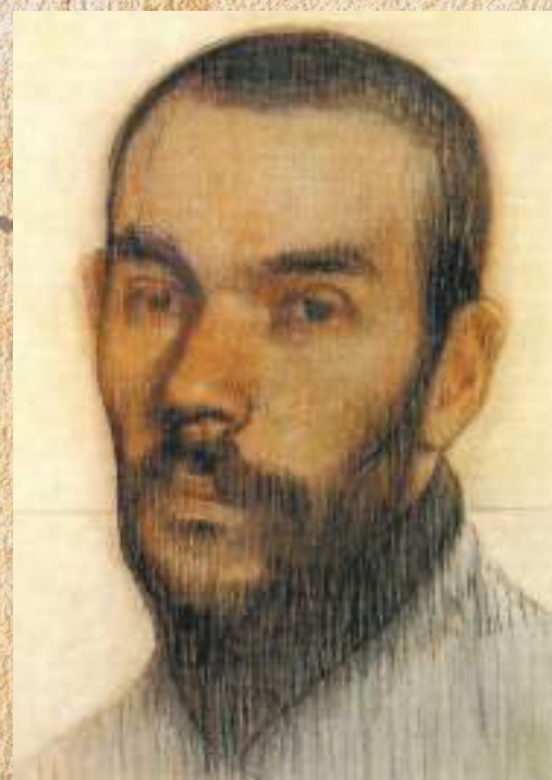
ЧАЧБА А. К. (ШЕРВАШИЗЕ). АВТОПОРТРЕТ