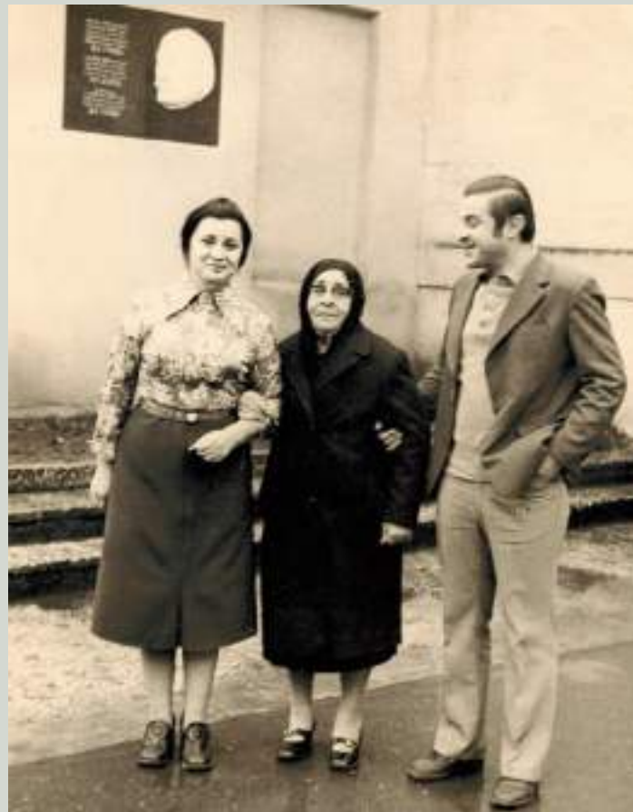
ЕҒЕРИ КӨАҒӘАНИАЦХА, ЕЛЕНА АНДРЕИ-ИЦХА ГӘЛИА, ДЫРМИТ ГӘЛИА ИМАТА ДМИТРИ АМУЗЕИ АҒАЦХА

Изакейтә ҕнытқатә мчхара дуузеи, иакыу казшы гәгәузеи ари апхәыс цшза иаалырцшуа! Изакейтә гәгәузеи, зака итаулоузеи лыбзиабара! Зака агәрагара атцоузеи уи ачархәара даҒагыланы иаалырцшуа агәаҒра! Лцәаныррақәа рыгәра угоит хәақәа-цақәада.