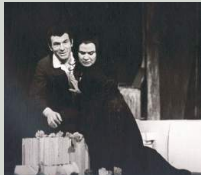
ЛЕОНИД АҒЗБЕИ ЕҒЕРИ КӨАҒӘАНИАЦХАИ Ж. АНУИ ИСПЕКТАКЛЬ «АНТИГОНА» АКНЫ

Цыцх 90 шықәса цит Ацсны жәлар рартистка, ина-лукааша ацсуа актриса, аиҒагаҒ, ганрацәала абаҒхатәра ду злаз арҒиаҒы, асценаҒы иацылцгаз ахаҒсахьақәа ры-ла Ацсуа театр хьтәы нбанла зыхьз назаза ианыцгаз, ЕҒери Кәағәаниацха диижьтеи. Уи арыцхә хтәылаҒы азәҒы иазгәеимтеит. ЗырҒиаратә шәымтә дыштәгылаз, аибашьра мца аилашымтәз иҒахаз хмилиҒтә гәадурақәа ируазәку актриса илызкны иубилейтә хәылцазы хзы-мҒацгыгеит. Уи ани-ари хәа акәымкәа, зеггы еицаҒха-роуп, даара илахьейқәдгагоу, хкультура иахьатәи атагы-лазаашьаҒы икоу апроблемақәа хзырбо хтысуп. АҒәа-ра уадафуп изеицшрахаша хмилиҒтә казара адеицш, уи агәадурақәа, аиатцәахәкәа, амилаҒтә бакақәа ас иаар-марианы иахьахарштуа, еиҒагыло абицара ирылаҒ-мыртцәо хнейлар?! Сгәы иаанагоит, урт рыхьзқәа реи-тарҒыцра, ирылшаз, икартцаз ишахәтоу еицш еиҒагыло абицара рызнагара харт, иахьа макьана зыцсы тоу иахуалцшыоуп хәа!