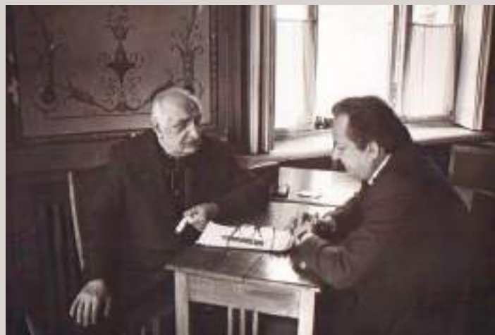
БАГРАТ ШЫЫНҚАБЕИ РАЖДЕН ГЭЫМБЕИ

Гэымба Ражден Цьгэатан-ица Ацсны Ацынцтэылатэ еибашьра ашьтахь Гэдоутэ ақалақь акны еиқыкааз, имөақэитцаз ацэбаба дузза ацын. Аибашьра ашьтахь 1995 шықэсазы Шэача ақалақь ахь инацхьан (Р. Гэымба ибзоурала) х-ансамбльк: «Нартаа» (асахь. нап. Р. Гэымба), ансамбль «Ритца» (асахь. напх. Уанаға Гиви), ансамбль «Адац» (асахь. нап. Дбар Руслан).