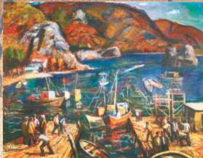
АФЗБА ХФ. Т. АПСЫЗКЫФЦФА