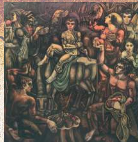
ГАМГИА В. В. АДГЪЫЛИ АУААИ