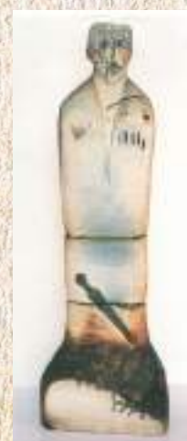
ХФЫРХФМАЛ В. С. АБШТРА РЫЗХФЫЦРА