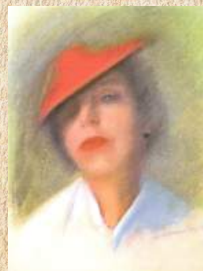
АШЛИПА КАЦШЬ ЗХОУ АЦХӘЫС