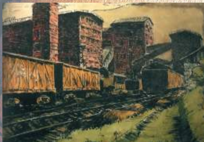
ЦЪЫНЦЪАЛЦХА З. К. ТКФАРЧАЛ