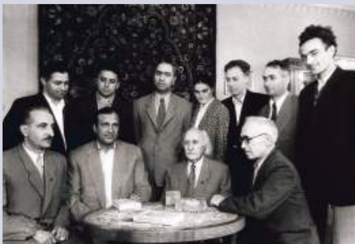
Дырмит Гәлиа ашәкәыәцәа рыгәтәны

– Иуасхәарызеи, уалымгац, макьана исәхәауа сгәы иахәоит! – ихәеит иара, – амала хәикәшәара ара атцыхәа