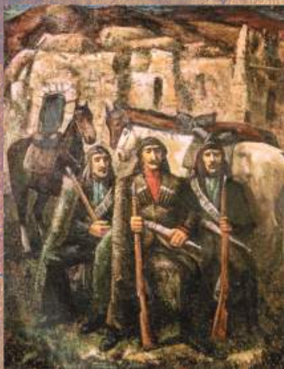
АФЗБА ХФ. Т. КЪАРАЗАА