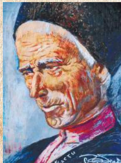
ГАБЕЛИА С. М. КАСТЕИ АРСЦАА ИПОРТРЕТ