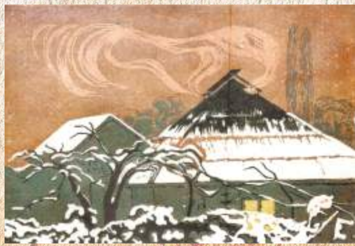
ЦЪЫНЦЪАЛЦХА З. К. АЗЫНТФЕИ АМОТИВ